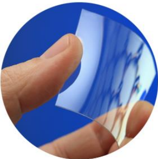
avanço da tecnologia