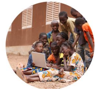
expansão do conhecimento