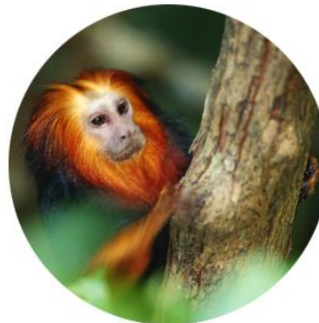
alteração da biodiversidade