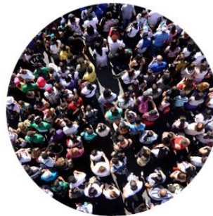
crescimento da população e da longevidade