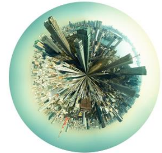
maior integração e diversificação