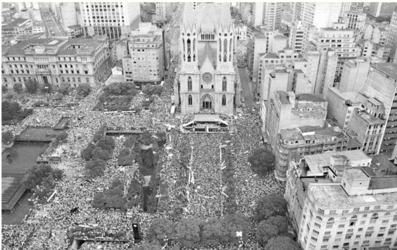
Praça da Sé (SP), 25/01/1984