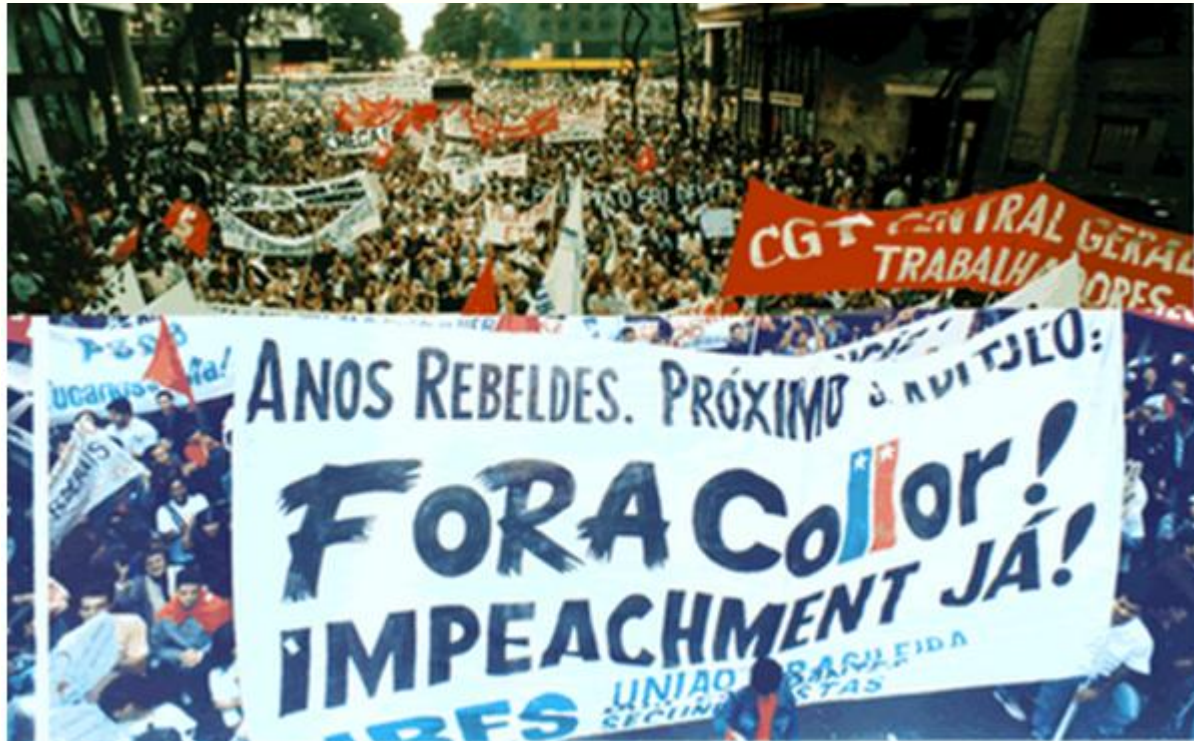
Avenida Rio Branco (RJ), 1992